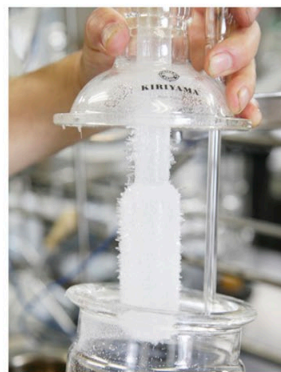
成長した結晶部分を崩すことなく取出す事ができます。